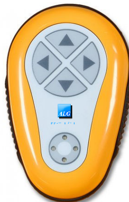
Controlo remoto RF