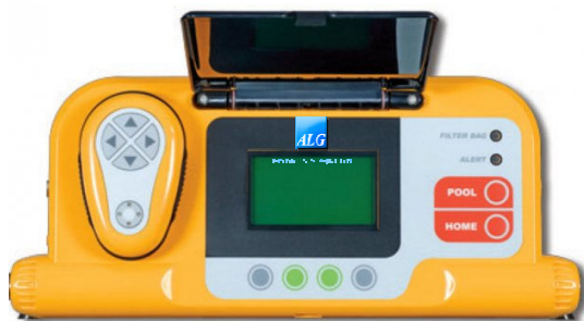
Central de comando