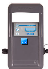
Nova caixa de comando